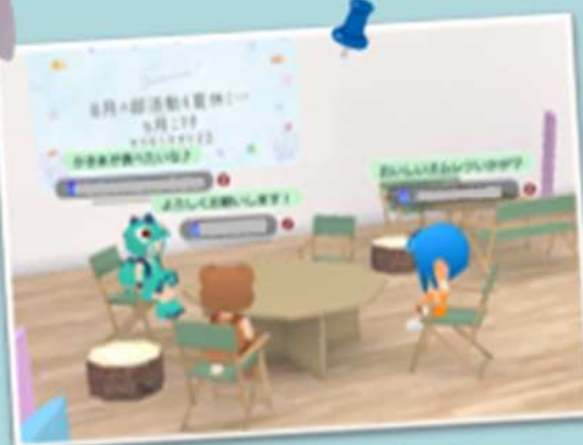
グループワークスペース