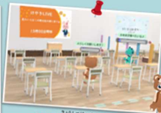
けやき教室配信エリア