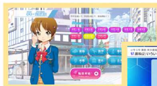
オンライン学習教材デキタストップ画面