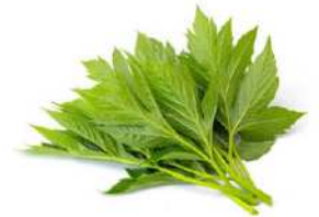
明日葉の花言葉「未来への希望」