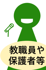
教職員や保護者等