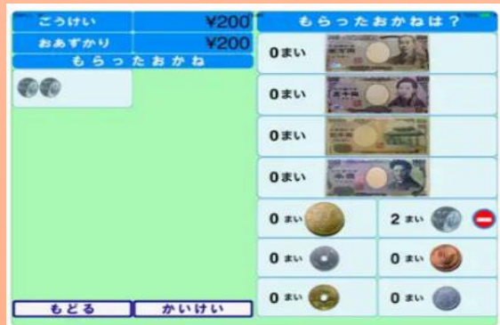
アプリ レジスタディ

生徒が会計時に必要な金額とおつりを理解するために、レジアプリを導入し、 商品と値段の登録をするなど、準備も含めて売り手の経験 もしました。